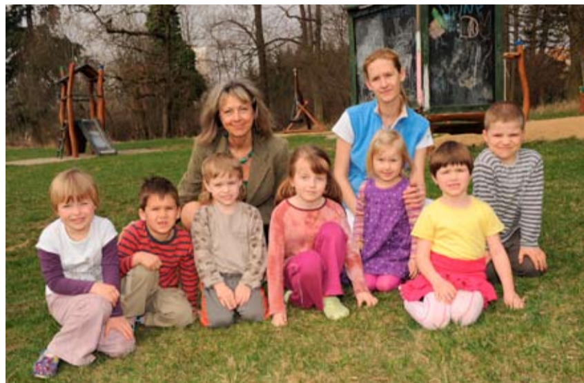
Paní ředitelka se dětmi, které se momentálně léčí.

Jedním z faktorů, že se snižuje počet dětí, je fakt, že rodiče upřednostňují pro dítě léčebný pobyt v jiné lokalitě, nejlépe na horách. Jejich obava, že léčba respiračních chorob v zařízení blízko Prahy nemůže splnit jejich očekávání, je však mylná. Zejména proto, že léčba je komplexem léčebných postupů, které zahrnují mimo klimaterapii řadu dalších, odborných, které jsou u nás na vysoké úrovni. Moderně zařízená část balneoprovozu, léčebná péče, rehabilitace, vše pod dohledem kvalifikovaných lékařů a sester,