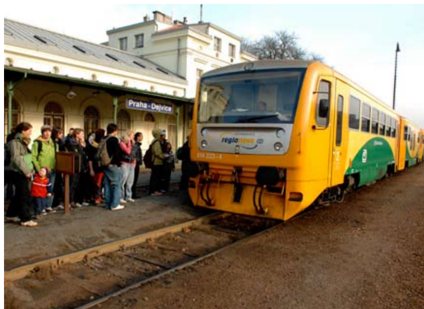
Pozor, na lince S5 z Prahy do Kladna bude výluka!

provozu mezi centrem Prahy a Velešlavínem. Výluka měla být původně zahájena v dubnu, nyní se předpokládá, že začne až v červnu. Důvodem posunutí termínu je zmírnění dopadů na cestující. Mezi stanicemi Praha-Velešlavín a Praha-Dejvice bude proto vybudována dočasná konečná zastávka tak, aby cestující nemuseli využívat jiných druhů dopravy, ale naopak měli přímou návaznost z vlaku na metro a tramvaje. Výlukový jízdní řád bude v dostatečném předstihu zveřejněn na webových stránkách Českých drah.