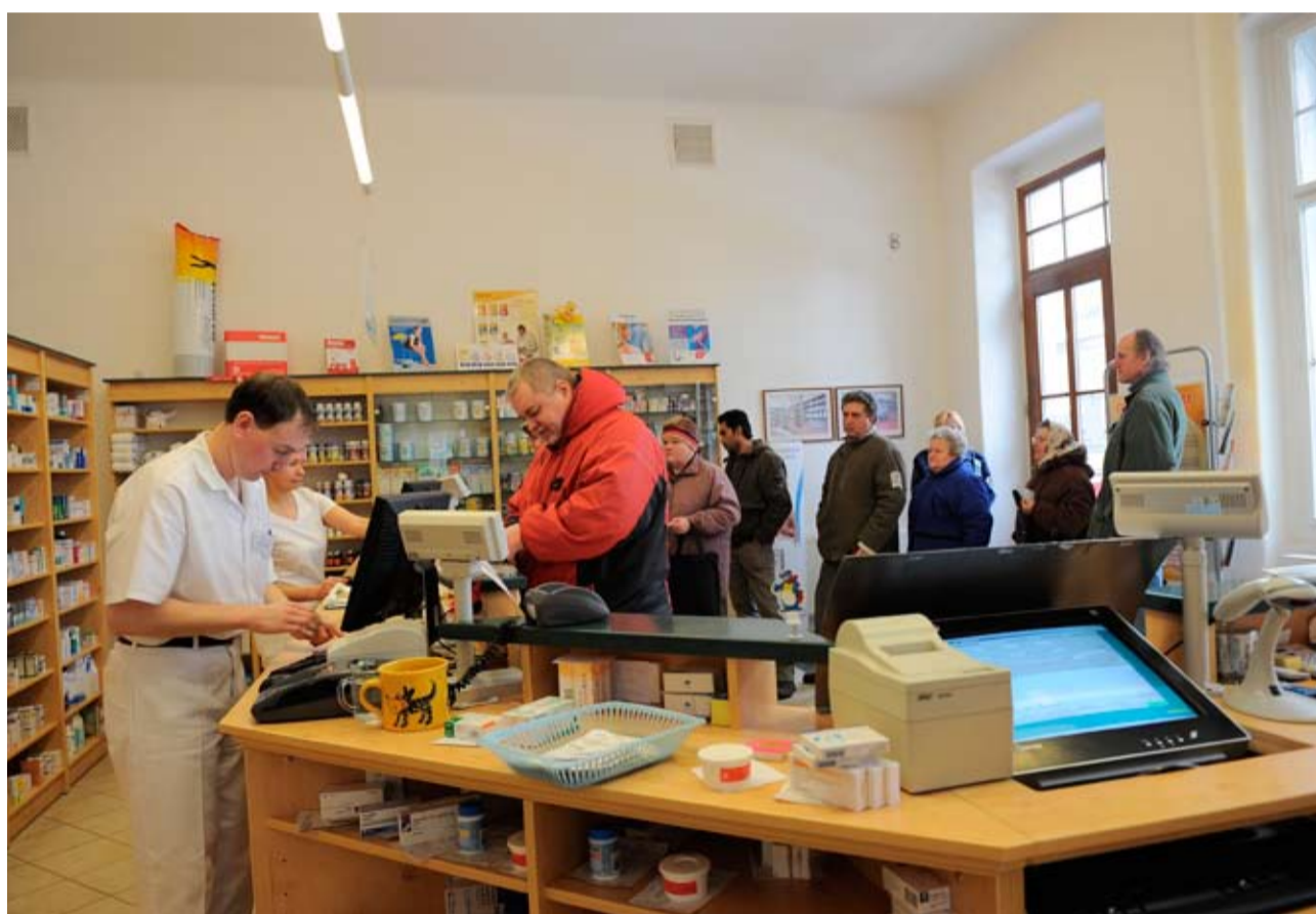
Místo proplácení poplatků lékárny zavedly slevy...

Slevu neposkytuje Středočeský kraj, ale jednotlivé lékárny, respektive nemocnice, pod něž lékárny spadají. Ty jsou ovšem zřizovány a dotovány hejtmanstvím. „Krajské nemocnice jsou v současnosti akciovými společnostmi. Pokud by se objevila další žaloba zpochybnující nově zavedený systém, musela by se týkat nemocnic, nikoliv kraje,“ zdůraznil David Rath. „Soud by musel rozhodnout, že obchodní společnost nesmí poskytnout slevu na zboží, které prodává. Což by bylo zajímavé rozhodnutí. Je málo pravděpodobné, že by nějaký soud takové rozhodnutí vydal, protože to pak může vyvolat celou sérii žalob