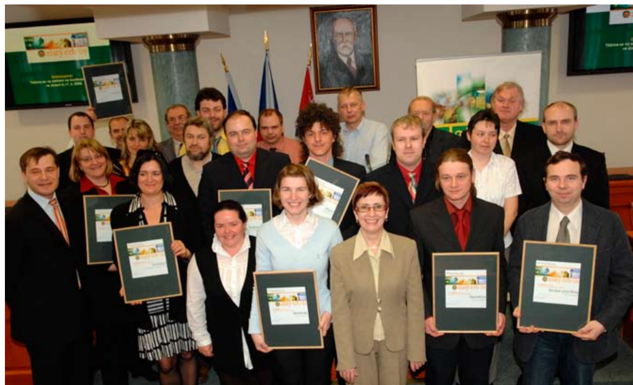
Společná fotografie zástupců oceněných měst a obcí...

v kategorii Nejlepší elektronická služba vybojovaly hned dvě »medaile« - bronzovou za službu Rozhlas do kapsy a zlatou za Webcall, neboli Vyvolávací systém na internetu.