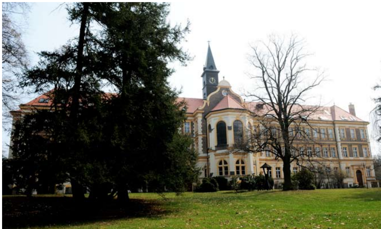
Prostředí léčebny doslova svádí ke klidovému režimu.

Výstavná budova v zdravém mikroklimatu inspirovala oboje okupanty k pokusu zabrat ji pro své vojáky. Naštěstí se žádný z nich díky obětavým a rozumným lidem neuskutečnil. Dnes však víc než tato zajímavá kapitola