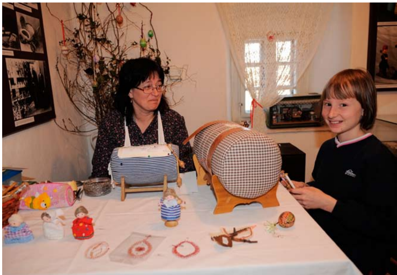
Ukázky dobových dovedností...

Největší pozornost budilo pletení tradiční velikonoční pomlázky. I když toto prastaré umění bývalo odjakživa doménou mužů, tentokrát