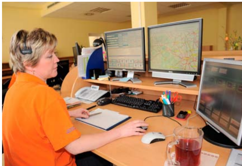
Nárazníkové pásmo, tedy dispečink záchranné služby.

záchranné služby. Jde spíše o setkání se všemi zaměstnanci, kteří na středočeské záchranky pracují, a to víceméně na neformální úrovni. Víím, že stejně jako všude jinde, i u nás mají zaměstnanci svoje velké či malé problémy, a budu moc rád, když jim v tomto směru pomůžu. Smyslem mých návštěv je také jasně deklarovat, že chci se zaměstnanci komunikovat nikoliv z pozice ředitele, ale z pozice jejich kolegy, protože k urgentní medicíně mám poměrně blízko. Jak velký „podnik“ vlastně středočeská záchranná služba je, kolik za-