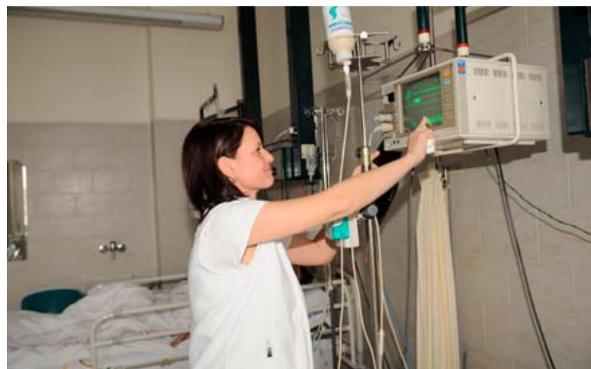
V kladenské nemocnici chtějí vyměnit dodavatele prádla.

Podobně vedení Středočeského kraje kritizuje provozování magnetické rezonance v Oblastní nemocnici Kolín. Nemocnice pro tuto službu pronajímá soukromé společnosti za 30.000 Kč měsíčně. Kraj chce, aby nemocnice této firmě buď zvedla nájem na desetinásobek, nebo si pořídila vlastní diagnostický přístroj a provozovala ho sama. Podle hejtmána je smlouva uzavřená v minulosti mezi zdravotnickým zařízením a provozovatelskou společností pro nemocnici nevýhodná. „Kolínská nemocnice pronajala prostory pro soukromou magnetickou rezonanci za nájem necelých 30.000 korun měsíčně. To je částka naprosto směšná, protože rezonance může vydělat měsíčně přes milion korun. Tržba od pojišťovny je něco kolem 2,5 milionu, možná i více,“ uvedl hejtman s tím, že rada kraje uložila řediteli nemocnice začít jednat o nových podmínkách nebo smlouvu ukončit. „Buď nemocnice nájem navýší minimálně na desetinásobek, nebo - což preferujeme - nájem ukončí a koupí vlastní přístroj nukleární magnetické rezonance, který bude sama provozovat,“ dodal David Rath.