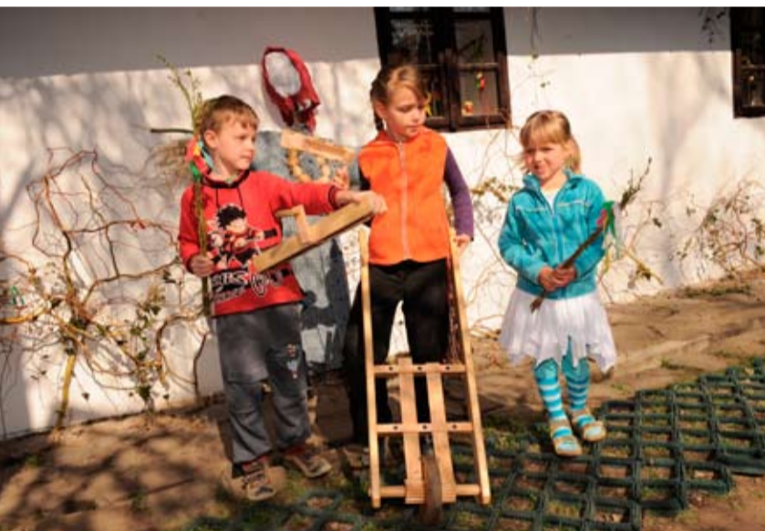
... a malí muzikanti!