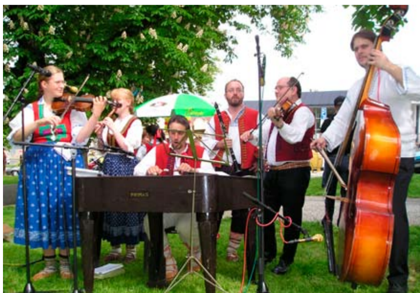
Folklor patří neodmyslitelně k májům.