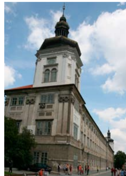
Centrem aktivit bude Kutná Hora.

na tvorbě programu pro stávající výstavní prostory a doprovodné aktivity, jednak pomáhat posilovat celkové P.R. instituce.